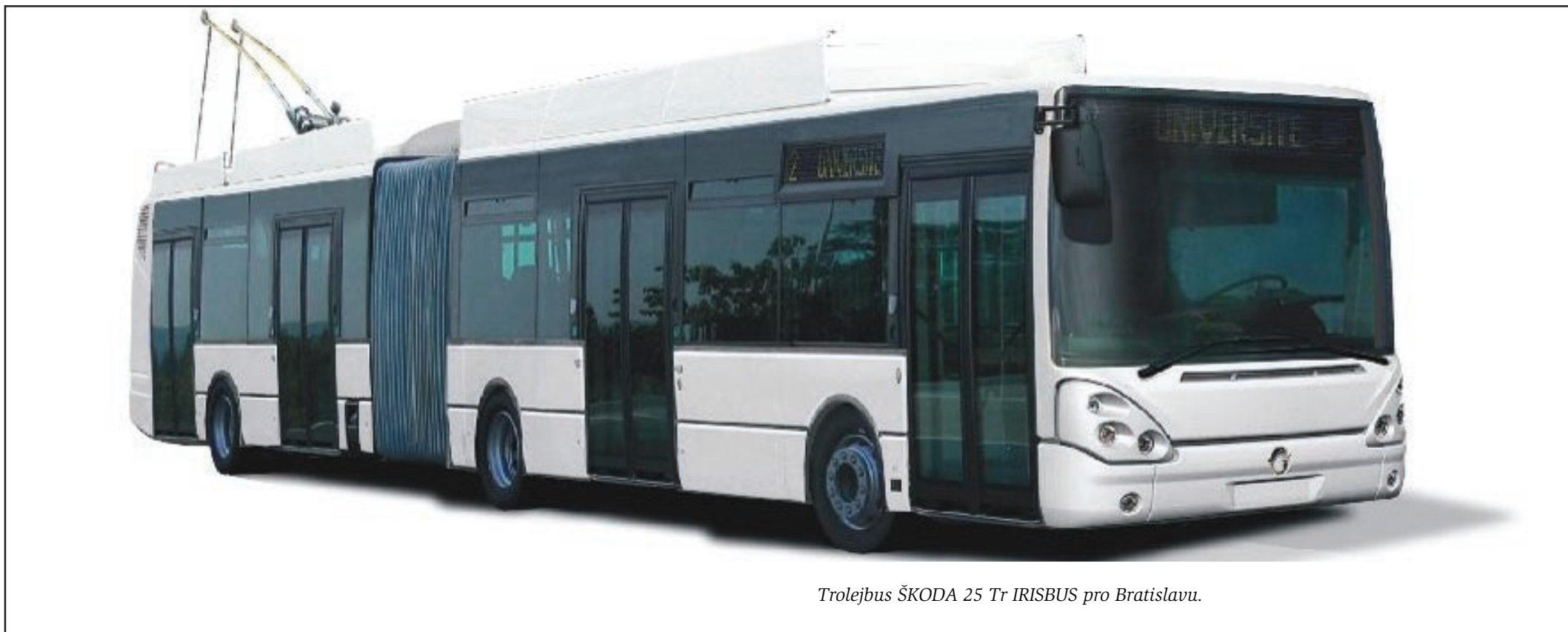
Trolejbus ŠKODA 25 Tr IRISBUS pro Bratislavu.