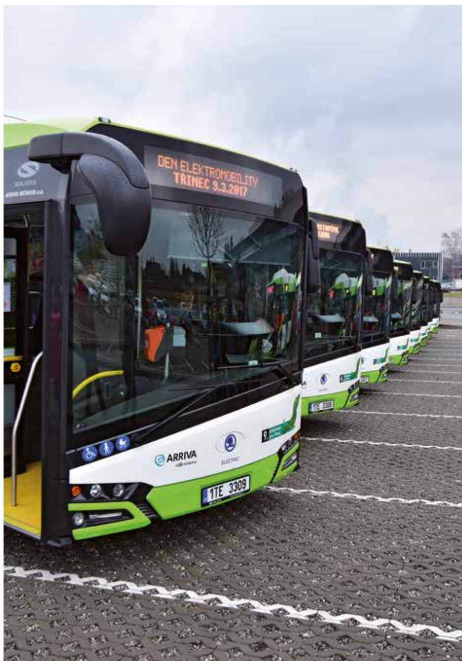
Škoda dopravci dodala deset elektrobusesů

Na přehlídce elektromobilů si lidé během odpoledne prohlédli například modely Tesla, BMW nebo, služební elektromobily města Třince, Moravskoslezského kraje a společnosti ČEZ. Příchozí si mohli vyzkoušet také kola, skútry nebo koloběžky poháněné elektřinou.