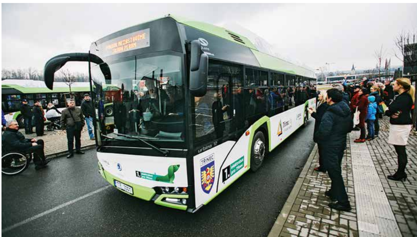
Premiéry elektrobusů v Třinci se zúčastnila laická i odborná veřejnost

městské hromadné dopravy nejen v ČR, ale v rámci celé Evropy,“ sdělil Radek Svoboda, obchodní ředitel Škody Electric. Elektrobusy mají kapacitu 75 cestujících, disponují výkonnou klimatizací, jsou nízkopodlažní a jsou vybaveny nástupní plošinou pro vozíčkáře. „Teď v první fázi nasadíme elektrobusy především na linky číslo 701 až 708. Chceme, aby se co nejvíce vyskytovaly v centru města a na třineckých páteřních linkách,“ říká ředitelka Arrivy Morava Pavla Struhalová. „Na jedno nabití ujedou v praxi 110–130 kilometrů, záleží však na charakteru a profilu trasy, na které se pohybují. Nabíjet je budeme vždy přes noc, v depu máme instalováno 10 nabíječek. Vozy se nabíjejí maximálně pět hodin.“ Slavnostního křtu se zúčastnil v Třinci