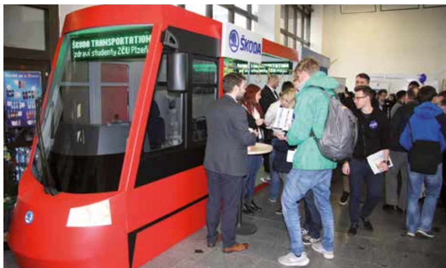
Stánek Škody na sebe vzal podobu tramvaje

Právě studentské veletrhy jsou jednou z přitažlivých možností, jak Škoda mezi studenty prezentuje možnosti vzájemné spolupráce. „Bez aktivního přístupu ke studentům nemůžeme získat ty nejlepší mladé odborníky, kvalitní absolventy,“ uzavírá ředitel Lidských zdrojů.