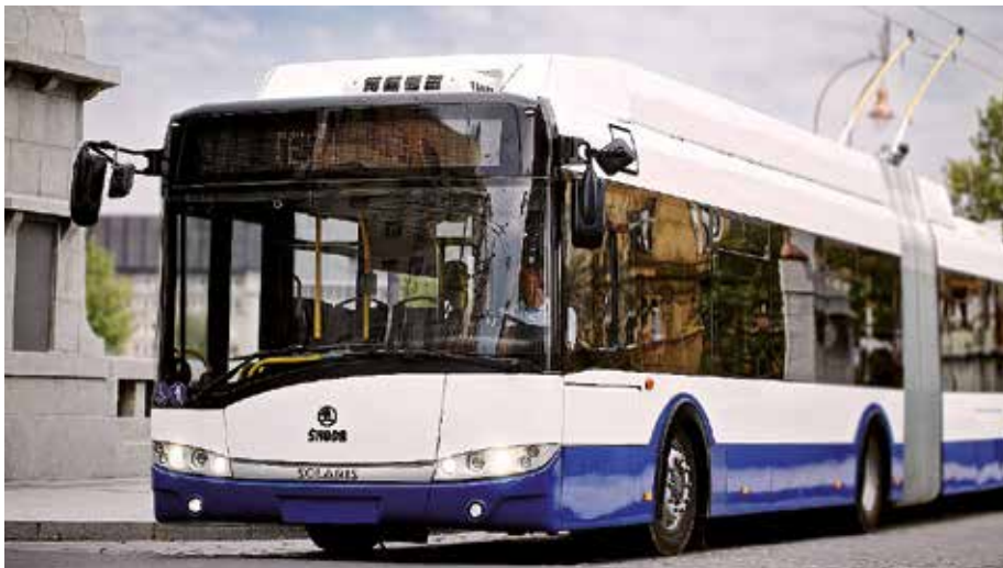
Trolejbus pro Rigu

Škoda Electric, která je členem skupiny Škoda Transportation, zvítězila ve výběrovém řízení vyhlášeném v roce 2013 řízkým dopravním podnikem (Rigas Satiksme). Součástí tendru bylo též zajištění financování (postupně