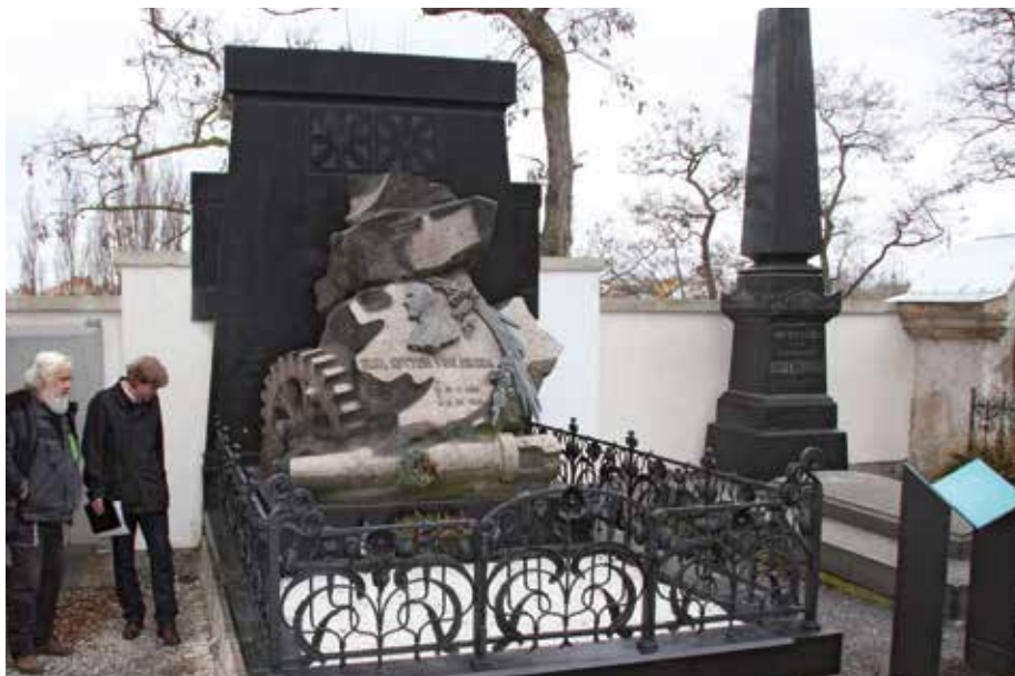
Rekonstrukce pietního místa obnovila poničené části do původní podoby

Podpis času i stopy vandalů smazány. Těmito slovy by se dal popsat výsledek náročné rekonstrukce hrobu slavného průmyslníka Emila Škody na Mikulášském hřbitově v Plzni. Opravu tohoto pietního místa iniciovala Škoda Transportation. „Financování a podíl na organizaci oprav chápeme jako samozřejmou součást péče o slavné historické dědictví spojené se