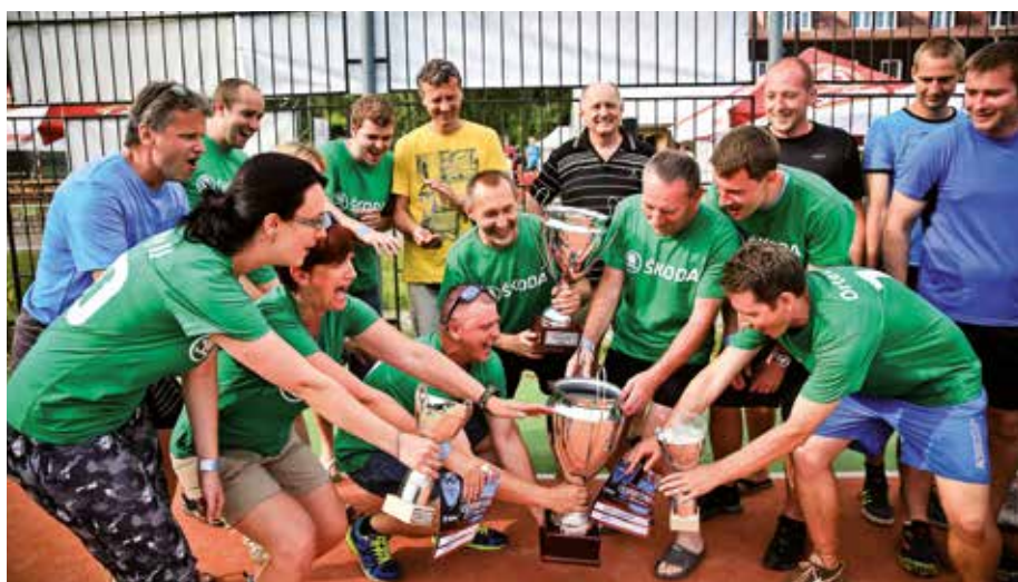
Kdo zvítězí letos?

speciální soutěže a aktivity, chybět nebudou různé hry. Velkou atrakcí určitě bude tolik oblíbené malování na obličeje, projížďky elektrickými miniauty, skákací hrad a zajímavým bodem programu bude kouzelnická show. Dospělí zase určitě ocení večerní program. K tanci i poslechu zahraje DJ. Po celý den bude k dispozici bohaté občerstvení zdarma.