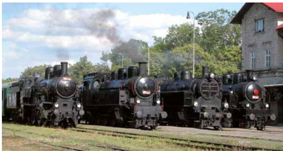
Muzeum Lužná u Rakovníka

devatenáctého a dvacátého století až po nejvýkonnější stroje, které zažily vrchol a postupný útlum parní trakce v druhé polovině století dvacátého. To však zdaleka není vše, co muzeum nabízí. Další atrakcí v Lužné jsou i oblíbené jízdy nostalgických vlaků několikrát ročně, takže zájemci mohouokusit cestování v historické podobě. Třeba 8. či 29. 7. se lze vydat parním vlakem na výlet romantickým údolím Berounky. Muzeum v Lužné chystá na prázdniny i další speciální akce. V létě, konkrétně 8., 15., 22. a 29. 7. a také 5., 12., 19. a 26. 8., se odehrají nostalgické prázdninové jízdy historickými vozidly z Lužné do Kolečovic.