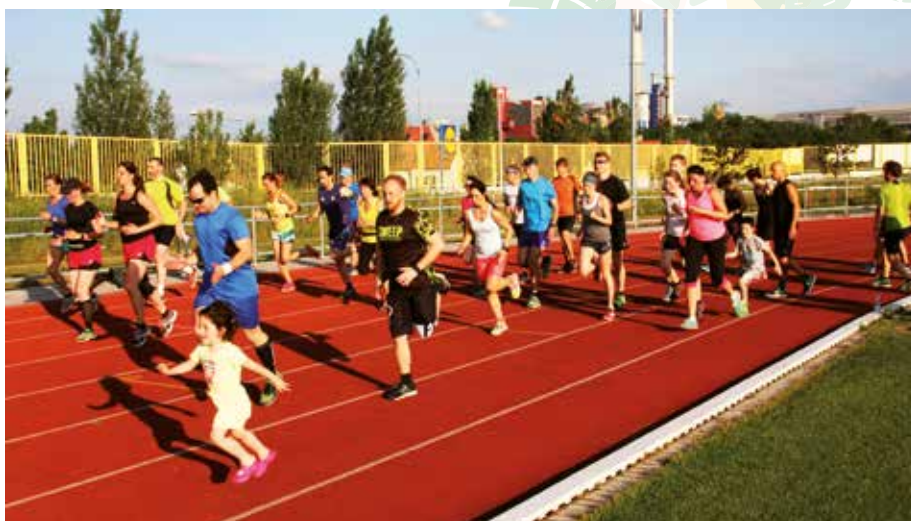
Nácvik běžecké techniky