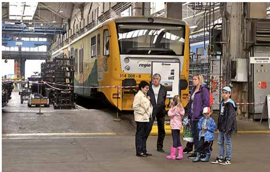
Jedním z vystavených vozidel byla Regionova

Organizátoři dne otevřených dveří nezapomněli ani na nejmenší návštěvníky, i pro ně připravili bohatý program – skákací hrad, kolotoč, obří skluzavku, zábavná vystoupení či projížďky vláčkem.