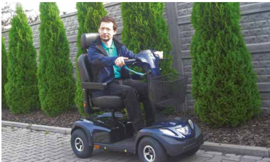
Jeden z příspěvků pomohl nákupu speciálního vozidla

A na co Škoda v poslední době přispěla? „Finance šly třeba na nákladnou léčbu pacienta nehrzenou zdravotním pojištěním, na úpravu motorového vozidla pro handicapovaného, nákup psacího stroje pro nevidomou holčičku, na zakoupení elektrického vozíku nebo jsme také přispěli na neurorehabilitační pobyt," připomíná Michal Tobrman některé aktivity.