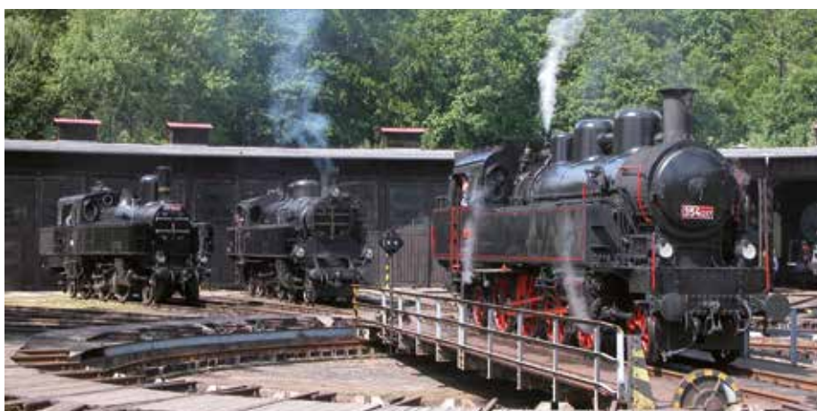
Muzeum Lužná u Rakovníka

Odhalit mnohá tajemství historie železniční dopravy. Přesně to nabízejí unikátní sbírky, které se v těchto – výletům zasvěcených - měsících otevírají návštěvníkům hned na několika místech v České republice.