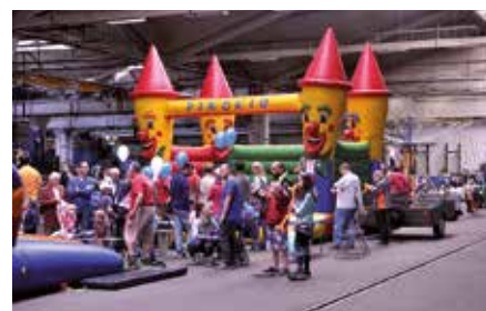
Organizátoři mysleli i na děti