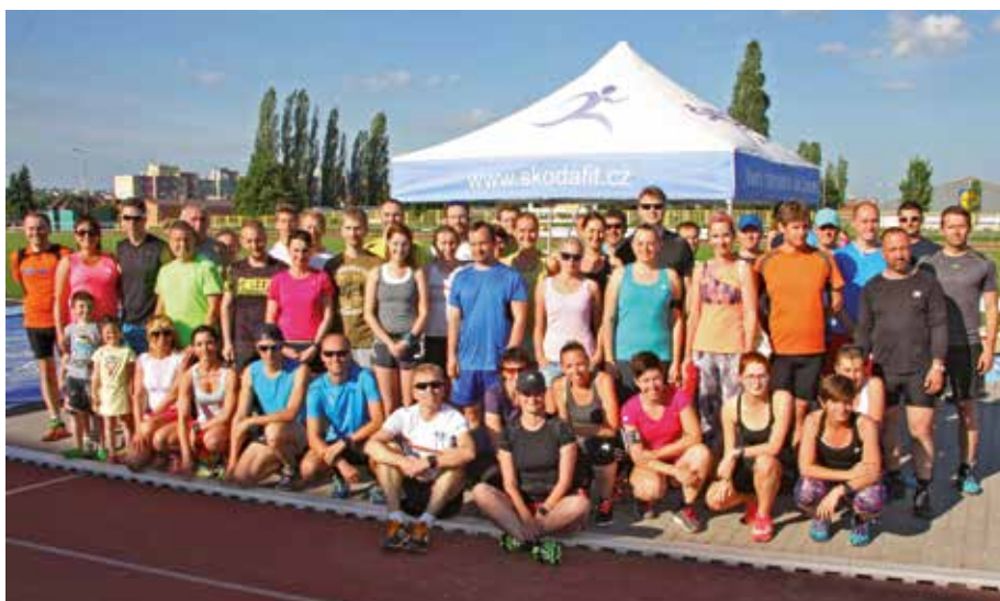
Už na konci června se sejdeme na výběhu zas!