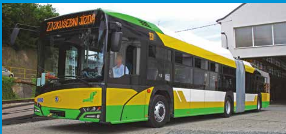
Trolejbus pro Žilinu

doplňuje Jitka Holá. Nové vozy nabídnou cestujícím i řidičům vysoký komfort. Vozidla pro Žilinu budou například vybavená výkonnou klimatizací, pasažérům poslouží USB konektory umožňující nabíjení telefonů v průběhu cesty i přehledný informační systém. Samozřejmě mostí nízkopodlažních trolejbusů je kneeling, který umožňuje snadný nástup a výstup z vozu.