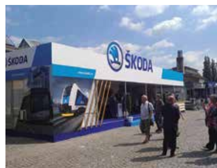
Stánek Škody v Ostravě

a drážní techniky Czech Raildays v Ostravě. Návštěvníci veletrhu z řad odborné i laické veřejnosti si mohli také prohlédnout modely mnoha nejnovějších vozidel s okřídleným šípem ve znaku. Samozřejmě nejdůležitějším bodem programu zástupců škodovackých společností byla jednání se stávajícími i potenciálními zákazníky, obchodními a dalšími partnery. Více o veletrhu už v příštím čísle firemního magazínu. V letošním roce se Škoda ještě bude prezentovat na veletrhu v TRAKO v Polsku nebo na veletrhu Nordic Rail ve Švédsku.