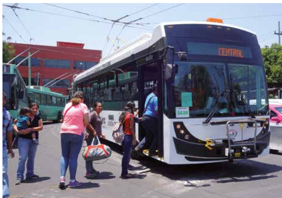
Nový trolejbus s cestujícími v Mexico City

Za dobu existence trolejbusové výroby dodala Škodovka na tuzemský i zahraniční trh více než 14 tisíc trolejbusů. České trolejbusy jezdí ve zhruba třiceti zemích světa – v Evropě, Asii a v severní Americe