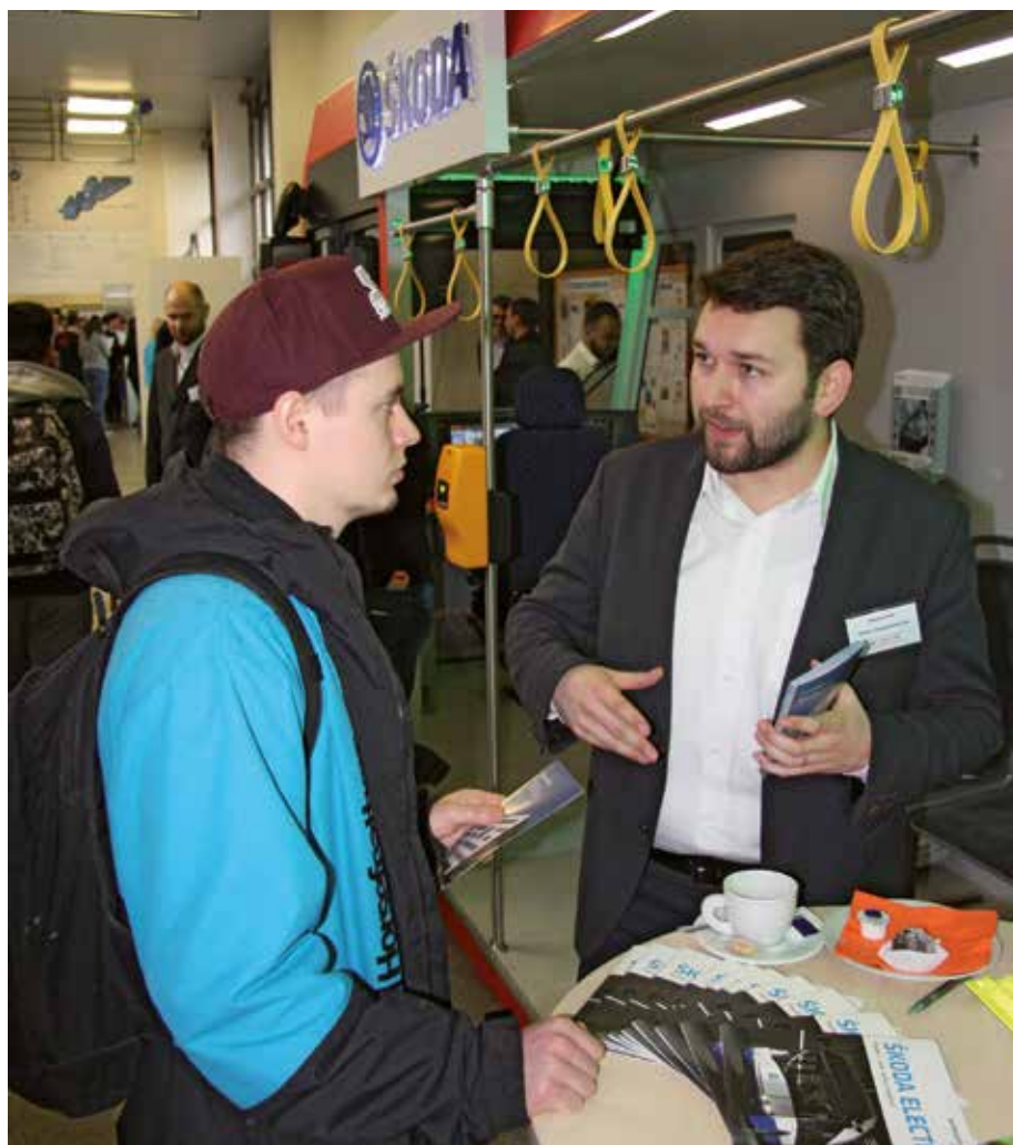
Škoda oslovuje studenty i při veletrzích pracovních příležitostí