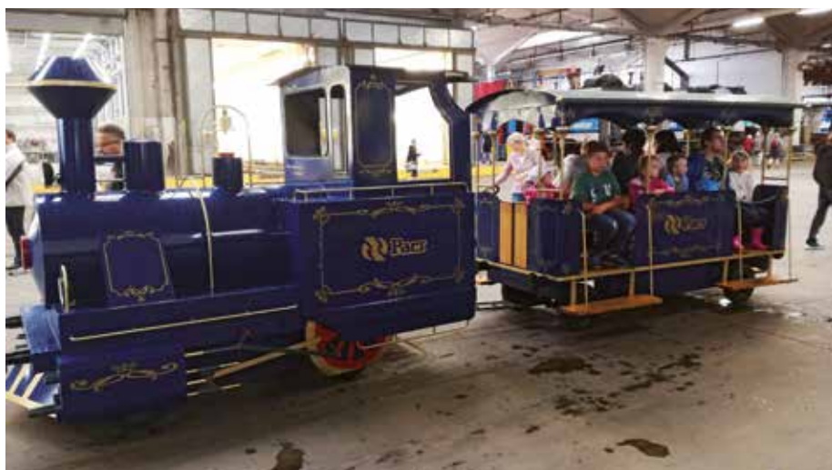
Nejmenší návštěvníky vozil vláček