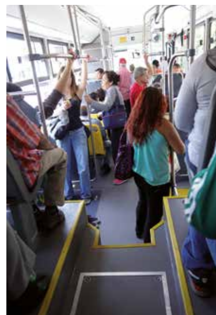
Pohled do interiéru vozu