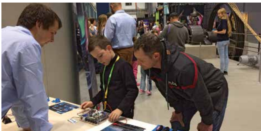
Dětem připravili technické pokusy specialisté Škody Electric