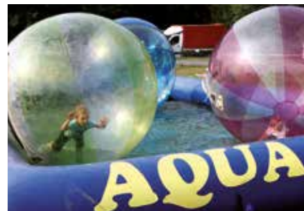
Děti bavil aquazorbing

zřejmě mohli po celý den využít bohatého občerstvení a zabavit se na přilehlých sportovištích, večer se pak mohli soutěžící i jejich blízcí bavit při hudebním vystoupení.