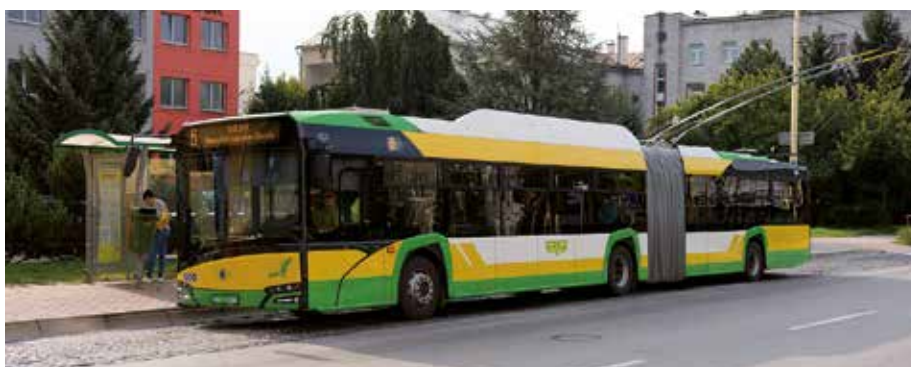
Trolejbus v ulicích Žiliny

První cestující se ve slovenské Žilině svezli novým trolejbusem Škoda 27 Tr, který pro tamní dopravní podnik dodala Škoda Electric. Vůz v tomto slovenském městě zahájil zkušební jízdy a obyvatelé a návštěvníci Žiliny si tak mohou vyzkoušet zcela nový trolejbus, pro který plzeňská Škodovka premiérově použila novou generaci karosérie.