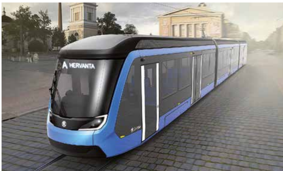
Vizualizace nové tramvaje

„Třetí největší finské město Tampere si na první etapu nově vznikající tramvajové sítě objedná devatenáct tramvajů ForCity Smart Artic včetně desetiletého servisu. Smlouva rovněž zahrnuje další tři opce na až 46 dalších vozidel. Nová zakázka potvrzuje, že se nám ve Finsku daří – na konci letošního srpna zúčinily Finské státní dráhy opci na dvacet dvoupodlažních osobních vozů a na konci loňského roku došlo k zúčinění další opce na dvacet tramvajů pro Helsinky