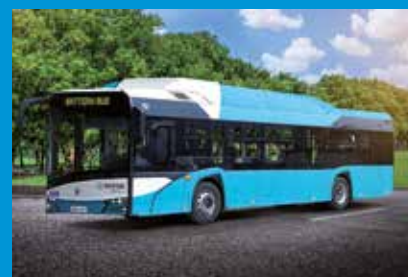
Vozidlo pro Nové Zámky