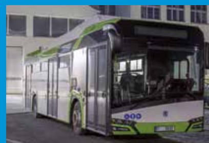
Vozidlo pro Třinec