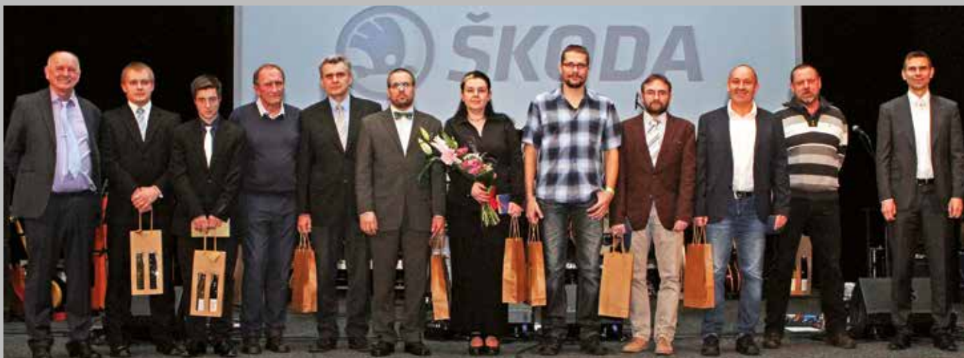
Nejlepší zaměstnanci společnosti Škoda Electric se zástupci managementu společnosti