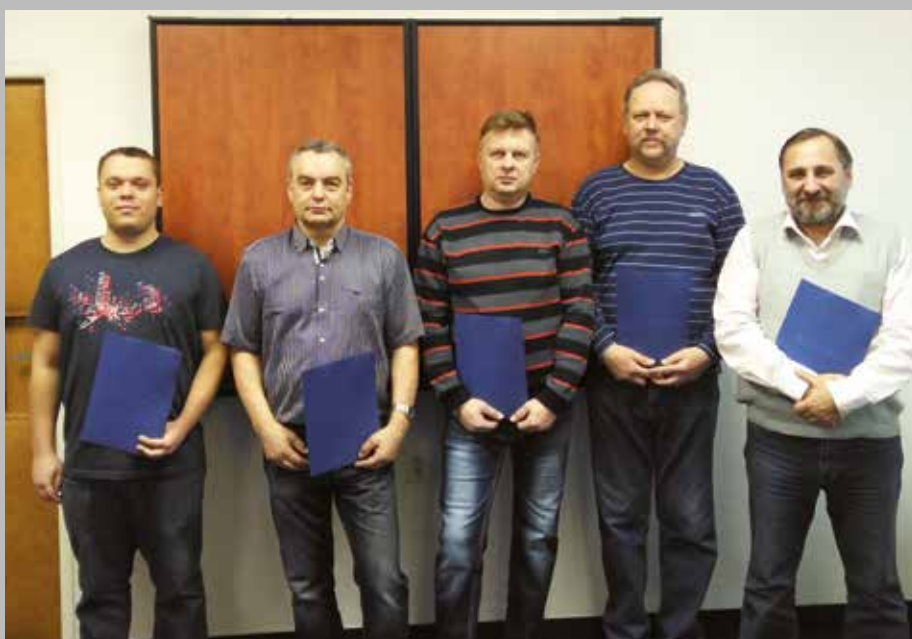
Nejlepší pracovníci Pars nova za rok 2017