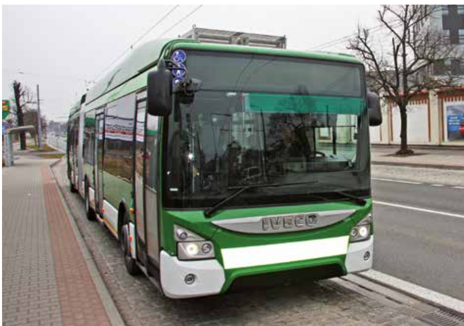
Nový trolejbus v ulicích Plzně