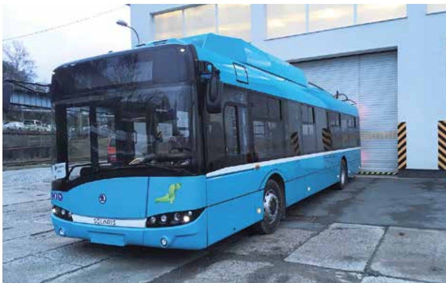
Trolejbus pro Ostravu ještě v areálu Škody Electric