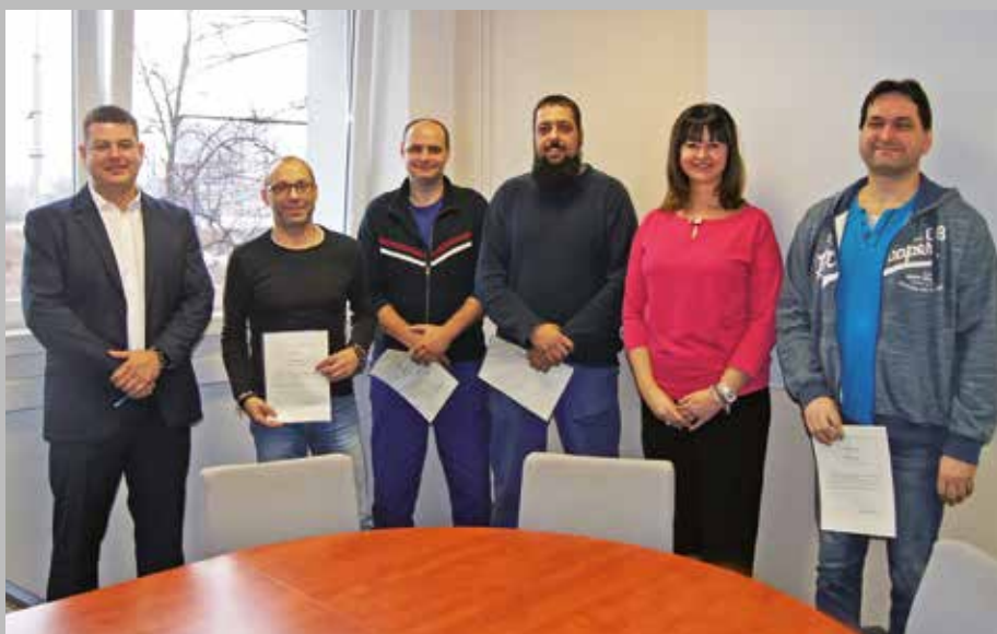
Snímek ze společného setkání oceněných zaměstnanců Škody Vagonka s vedením firmy