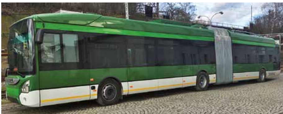
Moderní kloubové vozidlo vzniklo na základě spolupráce s výrobcem karosérie firmou Iveco

výrobcem trolejbusů. České trolejbusy jezdí ve zhruba třiceti zemích světa – v Evropě, Asii a severní Americe. Kromě tradičního vývoje a výroby trolejbusů představila Škoda Electric