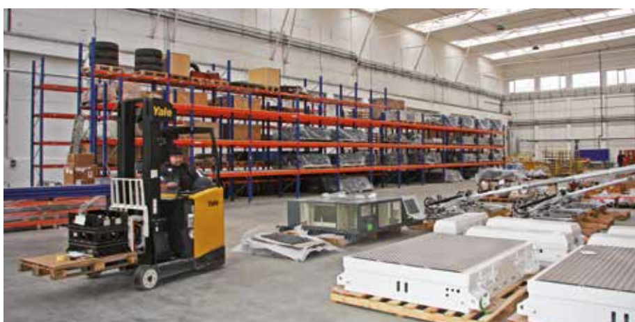
Na místě někdejší svařovny a lisovny vyrostl moderní skladovací areál

„Na místě této nevyužívané budovy vznikne manipulační a odstavná plocha, například