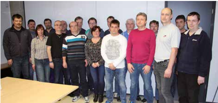
Nejlepší zaměstnanci 2017 včetně vítězů zlepšovatelského hnutí představil úsek Výroby na společném setkání

Drobné náměty, které přesto umí zjednodušit práci, ale i nápady, které firmě šetří miliony korun. I tak vypadaly nápady zlepšovatelů ve výrobě plzeňské Škodovky v loňském roce. A právě za těch uplynulých dvanáct měsíců se jich sešlo rekordní množství. A stejně tak nejvyšší byl počet těch, které se opravdu zavedly do praxe – totiž úctyhodných 274.